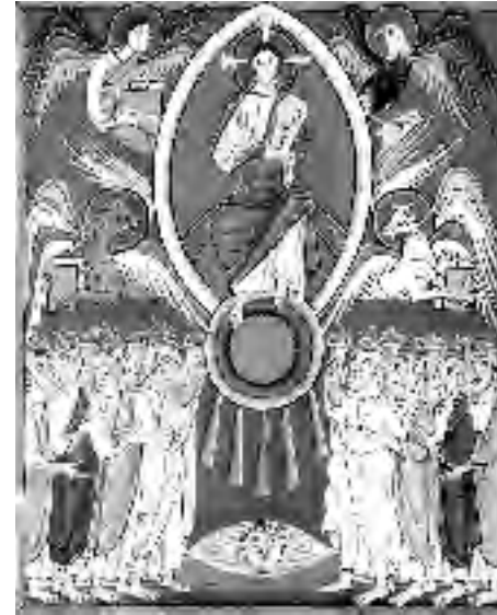
'De Tronende', Bamberger Apocalypse ca. 1200

Aanvullend vinden wij de volgende beschrijving: Vier van de twaalf zodiac-tekenen vormen samen 'het astrale kruis': stier, scorpioen/adelaar, leeuw en waterman. Dat wijst terug naar de zogenaamde astrale goden uit de Babylonische mythos. Zij zijn Nergal (een gevleugelde leeuw), Marduk (vleugelstier), Nabu (vleugelmens) en Mimurta (adelaar): symbolen van goddelijke macht. Hieronymus spreekt over Mattheüs als degene die Jezus als mens vanaf zijn geboorte en stamboom beschrijft en daarom de mens/engel als teken heeft. Over Marcus zegt hij, dat deze begint met Johannes de Doper te noemen als roeper in de woestijn, waar de leeuw in thuis is. Lucas begint met het offer van Zacharias; de stier was een offerdier. Door Johannes spreekt de van boven komende geest het sterkst. Daarom het beeld van de adelaar . Ook dit is een verklaring die verrijkend is bij de zoektocht naar de oorsprong van het samengaan van evangelisten met hun geestelijke, cherubijnse wezenheid. Allerlei gezichtspunten kunnen elkaar nu aanvullen om ons dichterbij het geheim van de sterrentaal en de afbeeldingen van de evangelisten te brengen. Wie weet ontdekken wij nog veel meer, als wij in alle rust de schilderijen bekijken die wij tot onze beschikking hebben? Wie de beelden op zich in laat werken gaat meer en meer hun taal begrijpen en hun boodschap horen. Daarin ligt ook het antwoord verborgen!