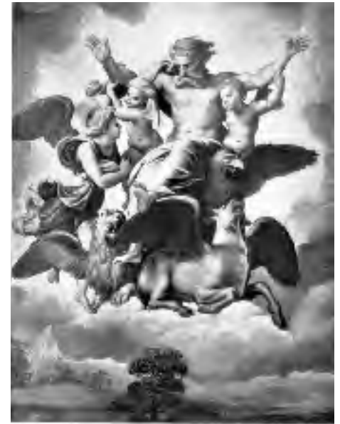
'Visioen van Ezechiël', Raphaël 1516

Het bekende beeld van de vierledige mens en zijn wezensdelen heeft zijn origine lang geleden. In de oudheid werden door de ingewijden vier wezenlijk verschillende krachten geschouwd en verbonden met de beelden die men in de kosmos zag. Reeds in de Babylonische tijd hadden sommige mensen de indruk van vier krachten die in vier van de twaalf dierenriemtekens konden worden beleefd. Zij gaven een viertal sferen weer die ook wij nu nog aan de nachthemel kunnen zien staan, en noemden deze: adelaar (of schorpioen), leeuw, stier en mens (of engel). Deze vier sterrenbeelden vormen met elkaar een groot kruis. Zij zijn voor ons enigszins herkenbaar door hun formaties van sterrengroepen, die lijken op de vier beschreven dieren, in het Duits 'Viergetier' geheten. Reeds in het Oude Testament kunnen we hiervan beschrijvingen vinden door de profeet Ezechiël (Ezech. 1, 1-14). Hij beschrijft hoe voor hem de hemelen open gingen en hij God zag, omgeven door een vurige wolk waaruit vier dieren zichtbaar worden die op een mens gelijken. Vier cherubijnen met vleugelen vol ogen verschijnen in de imaginatie van deze levende wezens. Dit heeft de schilder Raphaël op dramatische wijze in 1516 weergegeven als 'Visioen van Ezechiël'. Voorchristelijke afbeeldingen zijn mij niet bekend.