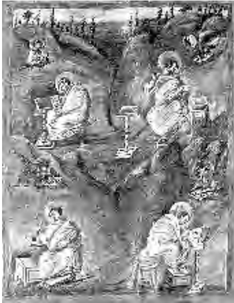
'De vier evangelisten', Aachen Evangelien ca. 800

de Grote. De evangelisten zijn geïnspireerd door hemelse wezens (dieren) bij het schrijven van hun teksten. Evenzo kunnen wij Catalaanse en Syrische schilderijen bewonderen, alsmede de beroemde 'Bamberger Apocalypse' uit circa 1200, gecreëerd in opdracht van keizer Otto de Derde. De vraag rijst, wat het specifieke karakter van de evangelisten te maken heeft met hun symbolen. Misschien komen wij er achter, als we kijken naar andere vierledigheden op aarde. Dan kunnen we denken aan de vier windstreken, de vier seizoenen, vier natuurrijken, vier elementen en ook aan de vier temperamenten van de mens. Draagt ieder van ons niet leeuw-, stier-, adelaar- en engelkwaliteiten in zijn ziel? Dat dachten de oude Grieken wél, ze schouwden de mens als beeld van de Sfinx, een wezen samengesteld uit deze vier gedaanten. Zou je kunnen zeggen, dat deze vier als zielekwaliteiten door de evangelisten werden gerepresenteerd en hun geschriften kleuren? Zijn deze ook in ons aanwezig in de vier temperamenten?