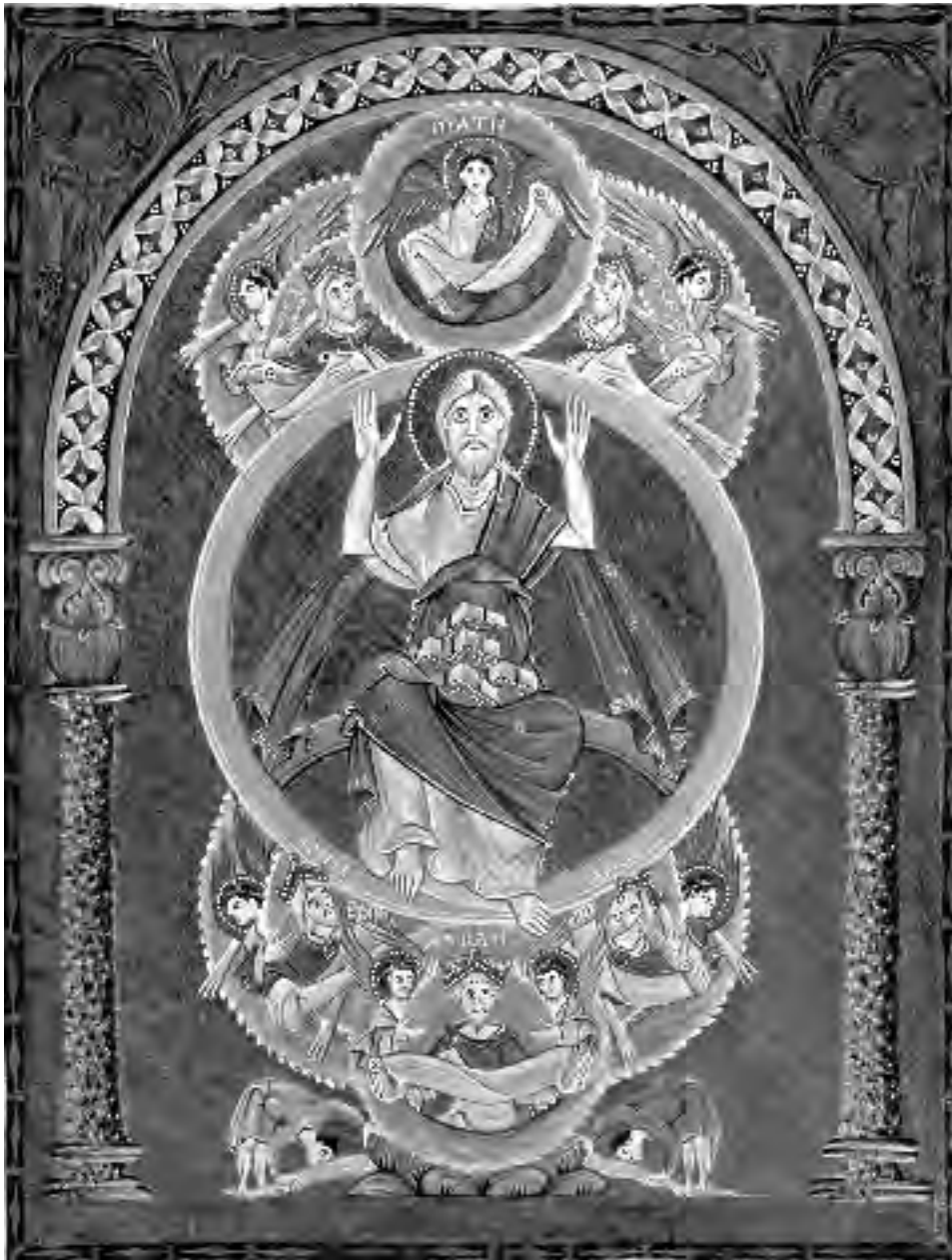
'De evangelist Mattheüs', Evangelarium van keizer Otto III

van Christus steeds opnieuw spontaan de wondtekens van de gekruisigde. 'Zij zag de lichtende gestalten van de gekruisigde levend vóór zich. Zijn wonden straalden als vijf lichtende kringen. Haar hart werd door een geweldige storm en door vreugde bewogen. Haar verlangen om mee te lijden werd bij de aanblik van de wondtekens zo heftig dat het was alsof het medelijden uit haar handen, haar voeten en haar rechter zijde naar de wondtekens van de verschijning toestroomde. Toen schoten eerst uit de handen, dan uit de voeten en tenslotte uit de zijde van de gekruisigde uit iedere wond drie bloedrode lichtstralen, die pijlvormig eindigde bij haar handen, haar voeten en haar rechter zijde. [...] Op het ogenblik van de aanraking ontstonden er bloeddruppels op deze plaatsen. [...] Zij voelde na haar stigmatisering een verandering in haar hele lichaam. Het leek alsof haar bloedsomloop zich omdraaide en naar de wondtekens toestroomde. Zelf zei ze: Dit is onuitsprekelijk.'