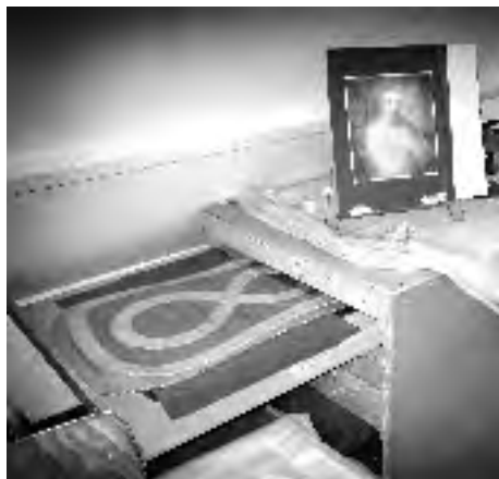
Kast met kazuifels (gemeente Meppel)

Wat hangt er zoal in de sacristiekasten? Ten eerste de gewaden, die voor iedere priester persoonlijk op maat gemaakt worden en die persoonlijk bij hem of haar horen. Dat zijn de zwarte talaar (betekent: gewaad tot de enkels), de witte alba (alba betekent wit), de stola's en gordels in acht kleuren (stola is een oude benaming o.a. voor een lange doek om de hals), de korte alba met de gepunte rand