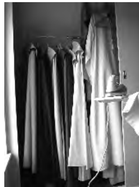
Kast met mantels (gemeente Meppel)

Is de talaar meestal van de van het dier afkomstige wol, een substantie die door zijn warmte kwaliteiten zeer verwant is met het menselijke lichaam, de alba is van een plantaardige stof: linnen met katoen. De witte gewaden die in de Openbaring genoemd worden zijn ook vaak van linnen, een stof die heel veel handelingen moet ondergaan, voordat hij geschikt is om tot stof te kunnen worden verwerkt. Zoals in het sprookje 'De blauwe bloem' (Karl Paetow: Sprookjes van Vrouw Holle) staat: gesleten, gedompeld, geroot, gerepeld, gedroogd, gebrakt, gezwingeld, gehegeld, gesponnen, geweven, gebleekt,