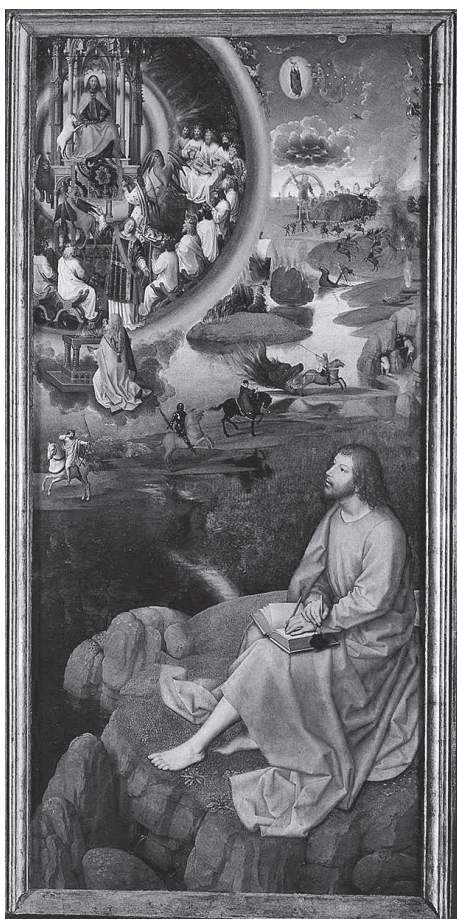
'Johannes op Patmos', Hans Memling (1479). Memlingmuseum St. Janshospitaal Brugge

Dat gebeurt niet vanuit de eigen kracht van de wijdingsdrager, voor wie het priesterschap evenzeer iets toekomstigs is als voor de gemeente. Het gebeurt dankzij het genadegeschenk van de priesterwijding. Ook de inzet-