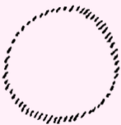
Eerste Logos God

Als u meer wilt weten over de diepere betekenis van de term Logos, kijk dan op https://anthrowiki.at/Logos . Daar komen de beelden in deze nieuwsbrief vandaan.