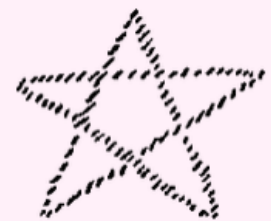
Derde Logos Microkosmos