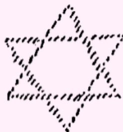
Tweede Logos Macrokosmos